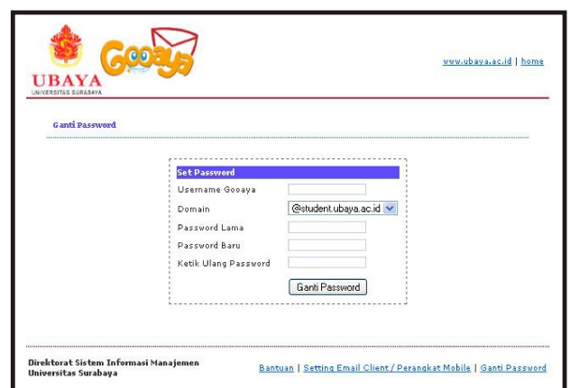
Gambar XX+1 tampilan halaman ganti password Gooaya

PENTING! Pastikan anda mengganti password terlebih dahulu untuk menjaga keamanan data anda. Pada halaman depan gooaya.ubaya.ac.id , klik menu Ganti Password di kanan bawah untuk mengganti password anda. Ketik Username Gooaya, Password Lama, dua kali Password Baru dan Klik tombol Ganti Password untuk mengganti password anda. Apabila muncul dialog verifikasi, klik OK untuk konfirmasi.